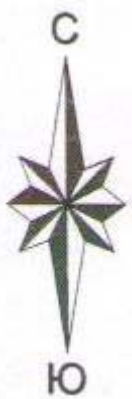
Схема расположения жилого дома